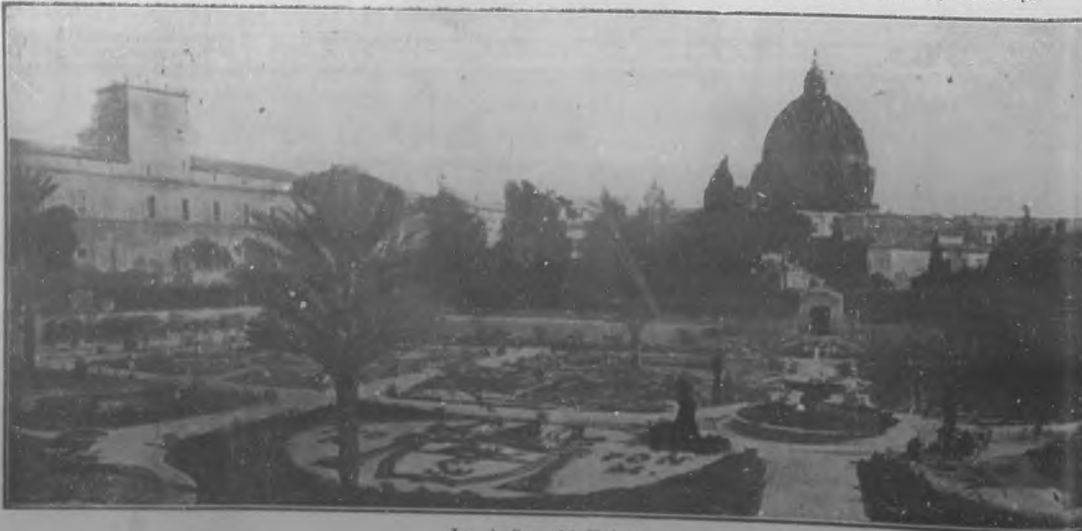
Los jardines del Vaticano.