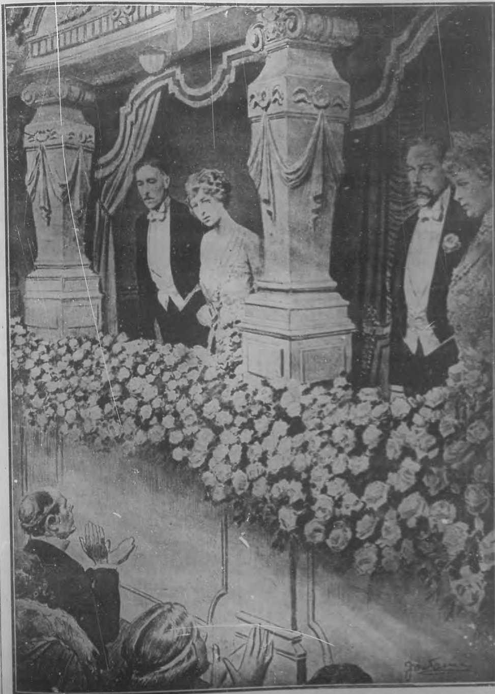
La princesa Mary, en unión de su prometido y de sus padres, los reyes de Inglaterra, en el Palco Real del teatro "Hippódromo", de Londres.