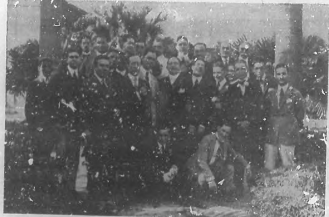
Grupo de las autoridades y periodistas que asistieron al almuerzo efectuado en la "Granja de la Habana".