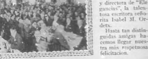
Vista general de la concurrencia que asistió al mencionado homenaje.

Hasta tan distinguidas amigas hemos llegado nuestra más respetuosa felicitación.