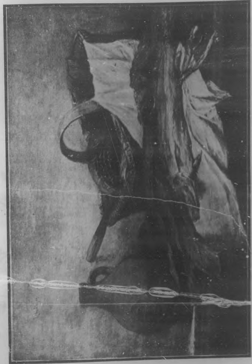
(Grabado tricolor de BOHEMIA.)