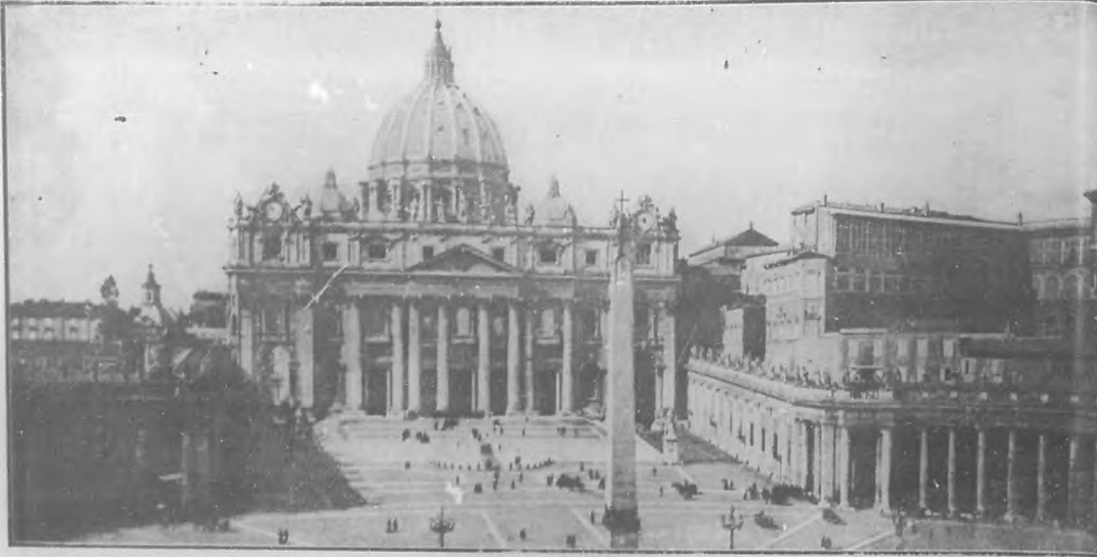
La Basílica de San Pedro, en Roma.

El mundo todo se ha sentido hondamente conmovido al tener nuevas de la muerte de Benedicto XV, el Sumo Pontífice que desde Roma regia los destinos de la cristiandad.