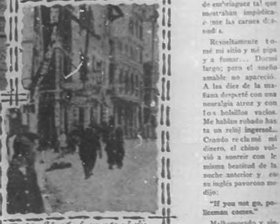
Pell Street durante el día.

La otra noche se me ocurrió—con motivo de la reciente refriega en que pereció el teniente Veville—visitar de nuevo la minúscula ciudad china, con el objeto de ver si había cambiado la fisonomía del barrio. Mi sorpresa fue grande al encontrarme con las mismas decoraciones, con los mismos cabarets y con los mismos rostros, pero sin fumaderos y sin aquel clásico teatro chino, tan famoso entre los neotivagos del arte.