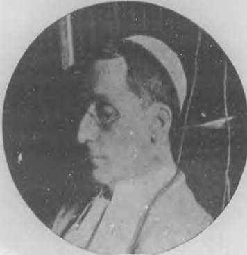
S. S. BENEDICTO XV

Hora era ya que los sucesores de San Pedro renunciaran, si no de derecho por lo menos de hecho, a la reconquista del Poder Temporal. Benedicto XV, viviendo dentro de las realidades de