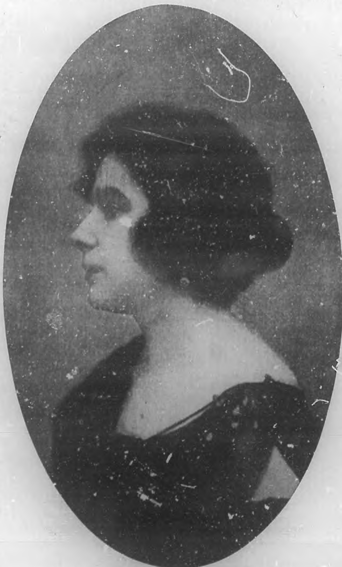
MARGARITA XIRGU La eminente actriz que con éxito insuperable actúa en el Teatro "Principal de la Comedia."

Acercera de sus obras predilectas nada quiso decirme. Las ama a todas, todas las hace con igual entusiasmo y cariño, y sonríe cuando alguien la (Pasa a la Pág. 22.)