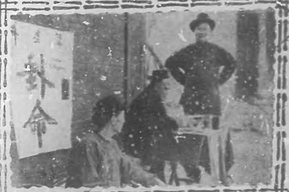
Espera en las mesas de estío en las calles de Chinatown.

A pesar del empeño de los soñadores y de los dueños de ómnibus, Chinatown, el legendario y trágico barrio del opio y de los crimenes, ya ha pasado a la historia.